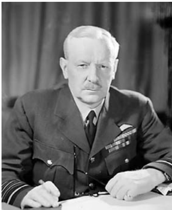
Air Chief Marshal Sir Arthur Harris (1892-1984) kjent i pressen som "Bomber" Harris, og i egne rekker enkelte ganger som "Butcher" Harris. (AOC-in-C) of RAF Bomber Command (from early 1943 holding the rank of Air Chief Marshal ) [3] during the latter half of World War II .

var heller ikke første gang norske myndigheter var i dialog med britene om bombemål i Norge. For å forstå den norske reaksjonen er det naturlig først å se på hvordan norske myndigheter forholdt seg til britene, og hvilken innflytelse nordmennene hadde for valg og prioritering av bombemål i Norge.