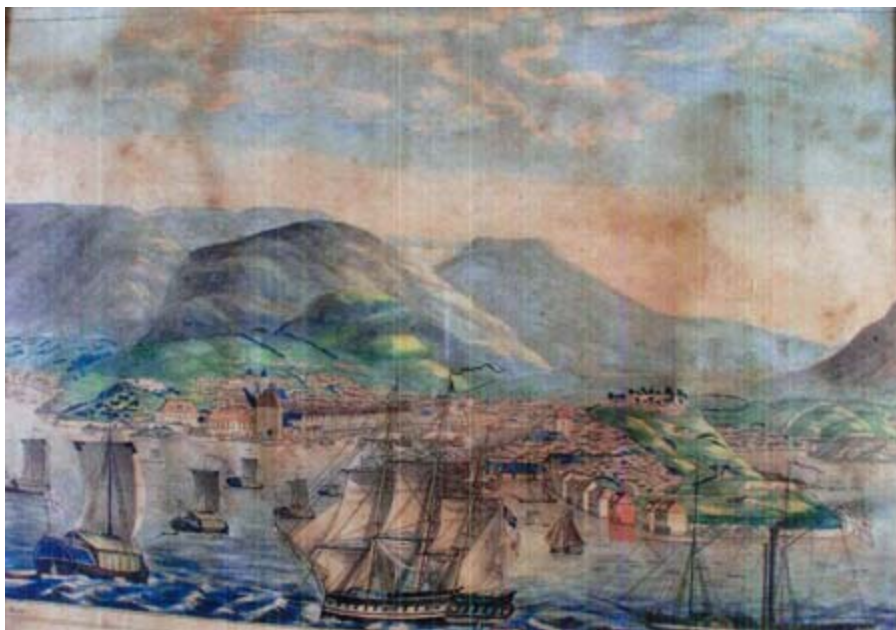
Bergensmotiv av I. C. Dahl, litografert av H. C. Knudsen