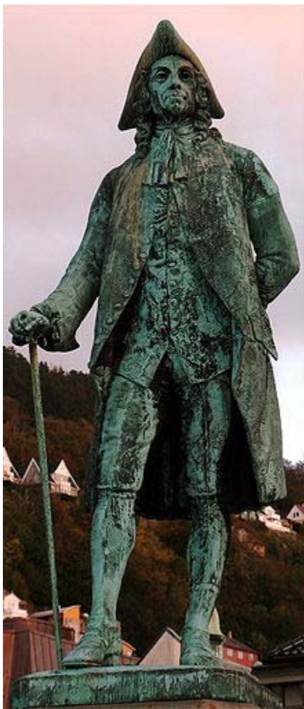
Statuen av Ludvig Holberg på Vågsalmenningen i Bergen.

Høyhed og Regiere-Syge var det Hiul som drev alting (Holberg 1738: 15, i fortalen).