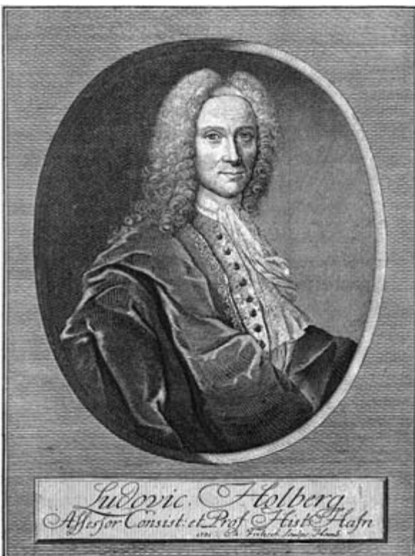
Ludvig Holberg som professor i historie ved Universitetet i København

En av de lastene Holberg flittigst beskriver er nidkjærhet- dette er en eksess som vanligvis ikke karakteriseres som noe godt. En annen og alvorlig last som Holberg trekker frem er vellystighet. Blant annet skisseres Korint som en spesielt lastefull by: "Korinth var nedsiunken udi Vellyst og alle slags grove Laster. Men St. Povel ved sine fyndige Prædikener udrøddede ikke alleene disse store Laster, men bragte mange af Indbyggerne til at øve Dyder udi høyeste Fuldkommenhed" (ibid. s. 52). Også keiser Nero skisseres som en "hofmodig og vellystig Mand..." (ibid. s. 66), og det samme var keiser Gallienus, som "slog sig til Vellyst og Overdaad.." (ibid. s. 59). Også Paulus av Samosata får en slik dom: "Udi samme Brev opregnes tillige med hans falske Lærdom hans uordentlige Levnet, blant andet at han indviklede sig i verdslige Sager, og vilde heller føre Titul af en Ducenario, det er : en Betienter af Finantzernes, end af en Biskop, at han gav Audience siddende paa en Throne, at han havde Omgjængelse med adskillige løse Qvinder" (ibid. s. 162).