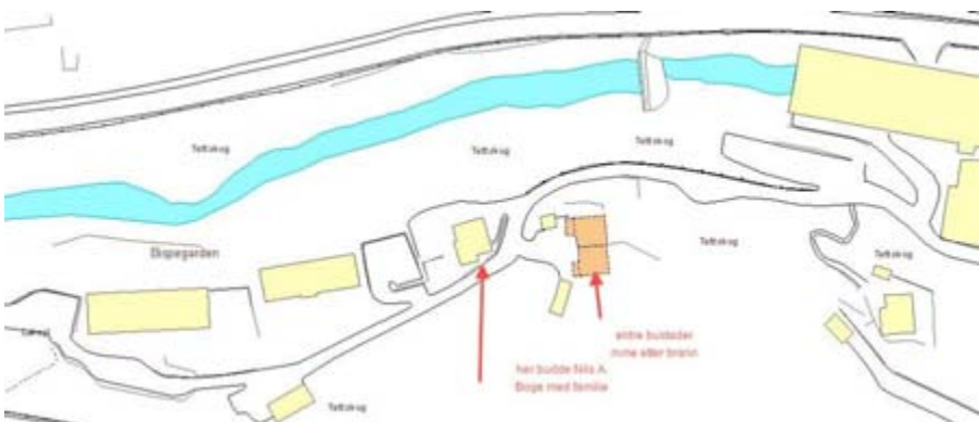
Kart over Bispegården.