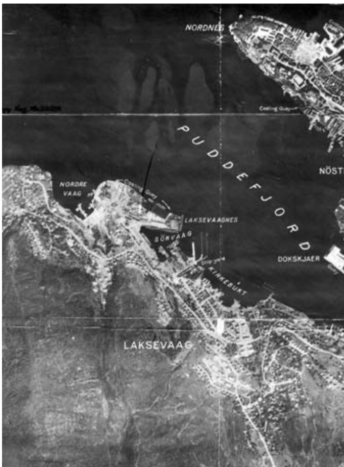
Bombemål s/n 102 Bergen

trente og erfarne flymannskaper. Amerikanerne var heller ikke enig at angrepet mot Herøya i juli var unødvendig, ettersom det var aluminium- og magnesiumsdelen av anlegget som var det primære målet, og ikke nitrat (gjødsel). Det norske forslaget om å bli innlemmet i beslutningsprosessen for bombemål ble heller ikke tatt nådig opp, og USAAF konkludert at det på operasjonell basis ikke var mulig å få dette til. Det var heller ikke aktuelt å ha en form for ad hoc løsning der norske myndigheter skulle konsulteres før beslutninger om bombing av