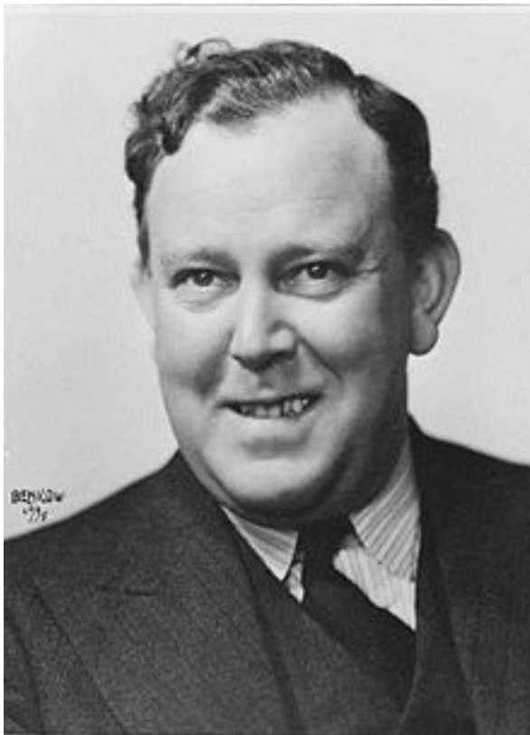
Trygve Lie (1896-1968) var norsk utenriksminister fra 1940 til 1946. Han ble i 1946 valgt til FN's første generalsekretær.

myndigheter. Da avtalen ble inngått hadde RAF Bomber Command allerede gjort to angrep på ubåtbasen i Bergen med katastrofale følger for befolkningen på Laksevåg og Bergen, samt avbrutt et angrep mot Trondheim 22. november. Men det var også andre aktører som hadde en agenda i Norge.