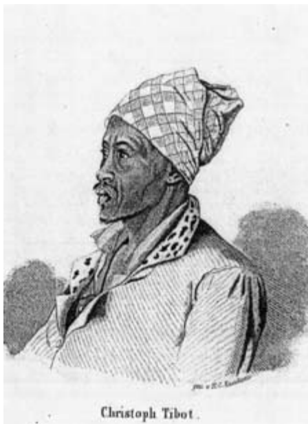
Over og under: Tegninger av H. C. Knudsen fra hans Afrikatid