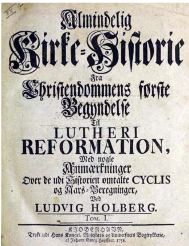
Tittelbladet til Ludvig Holbergs Almindelig Kirke-Historie fra 1738. Bildet er brukt med løyve fra Spesialsamlingene, UiB.