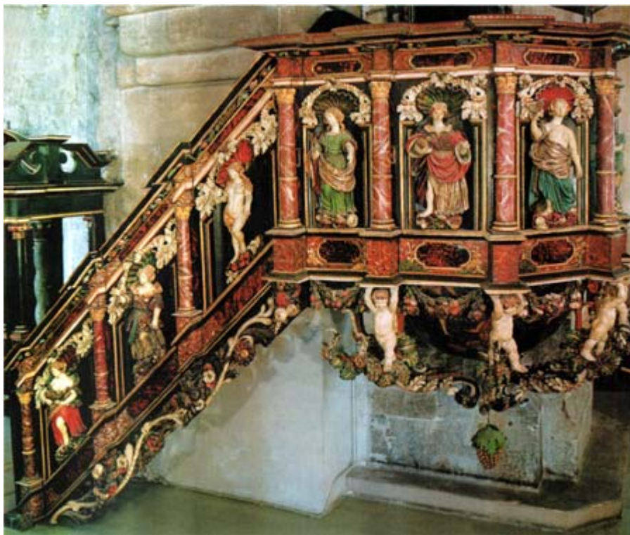
Prekestolen i Mariakirken i Bergen hvor dydene er avbildet. Kilde: Mariakirken i Bergen, Hans-Emil Lidén, Bergen, Mangschou 2000, s. 30. Fotograf: Egil Korsnes. Bildet er brukt med løyve fra Mangschou forlag.

som utgjør kjernen i den aller første, og reneste, tro. Holberg oppsummerer denne "renheten" slik: