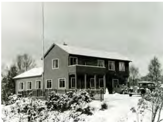
Bildet viser hvordan Skytterhuset på Øvstun ble seende ut etter krigen, med en stor sal i første etasje og kontorer samt vaktmesterleilighet i andre etasje. I kjelleren var det foruten våpensafers også en 15 meters skytebane.

utrede forskjellige alternative plasseringer for en fremtidig bane. En del mulige plasseringer ble vurdert uten at man kom frem til noen konkrete forslag.