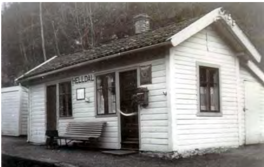
Helldal stasjon. Stasjonsbygningen i Helldal var mindre og langt enklere enn de andre på strekningen Bergen-Arna, og var et resultat av dugnadsinnsatsen til medlemmene av Bergen skytterlag.

Sædal, men hadde etter hvert solgt unna mye, og satt igjen med bruk 7 (der han bodde) og bruk 4, som «Skytedalen» tilhørte. Det er i dette grenseområdet mellom Helldal og Sædal vi har lett etter spor av skytebanen. Deler av området er nå bygd ut med boliger, og det som kan ha vært av spor er nå slettet, men oppe i Skytedalen finnes det i hvert fall en skyttergrav igjen.