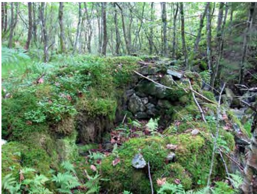
Skytedalen i Sædalen 2010. Denne graven var det best bevarte minnet fra den gamle skytebanen.

strømmen med sine rifler, sine familier, musikanter, mat og oppvartere. De samlede regningene for Alverstrømturen kom opp i nesten 200 kroner. I 1880 la de terrengskytingen på Grønne-stølen, et år var de på Lægdene, et annet år gikk turen til Blåmanen, og sommeren 1885 holdt de «dyreskytingen» i Helldal. På det tidspunktet hadde skytterlaget allerede inngått avtale med grunneierne i Helldal og Sædal om å få anlegge skytebane der. Avtalen er datert 28. februar 1885, men ble ikke tinglyst før i april 1886. Skytterlaget hadde på dette tidspunktet 112 medlemmer. Av disse var 70 aktive.