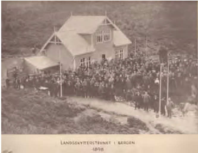
Dette er det eldste kjente bildet av Skytterhuset på Øvsttun. Bildet er tatt under Landsskytterstevnet i 1898. Helt til venstre vises inngangen til standplass for skyting på 600 meter.

Tyskerne overtok både bane og skytterhus i mai 1940. I løpet av krigen brente huset ned, og skivevollene ble ødelagt på grunn av tyskernes aktiviteter, så i 1945 fant skytterlaget banen igjen i en meget sørgelig forfatning. Alt måtte bygges opp igjen på nytt.