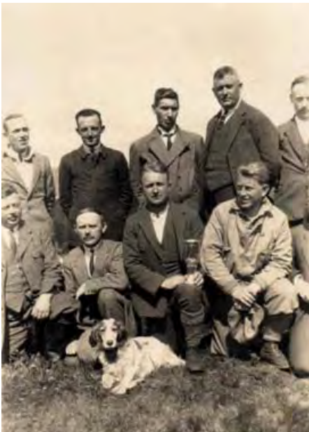
Olav Mo sammen med et knippe Bergenskyttere og en av hans faglehunder.

Han var 31 år gammel da han ble konge, og han fikk mesterskapsmedaljen sammen med skytterkongetittelen. Mesterskapsstjernen sikret han seg under Landsskytterstevnet i Stavanger i 1928. Under Landskytterstevnet i 1921 i Bergen satte han landsrekord på 800 meter med 29 poeng. Ved samme stevne var han med i omskyting om Stangmedaljen. Han var flere ganger nær ved å vinne denne meget prestisjetunge premien.