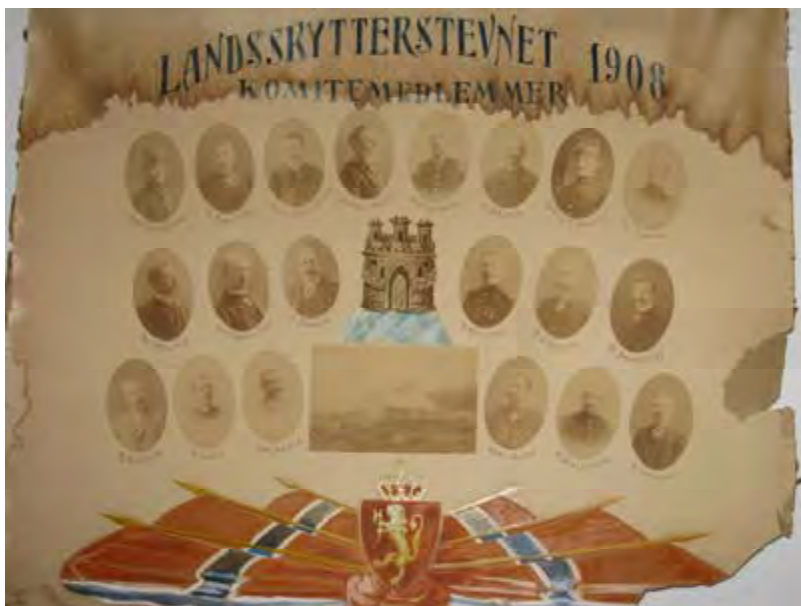
Plakat med medlemmene i hovedkomiteen for Landskytterstevnet 1908.