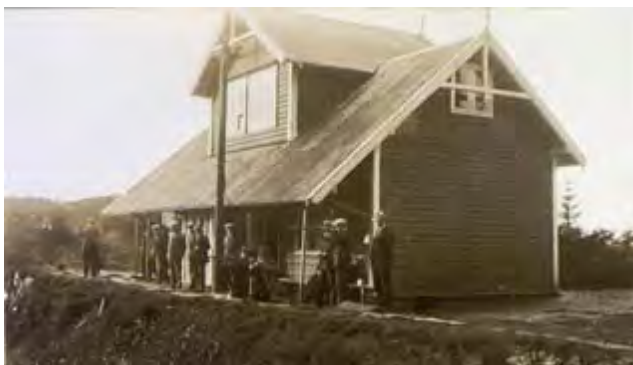
Bildet er fra 1925 og viser skytterhuset med standplass like i forkant av huset.