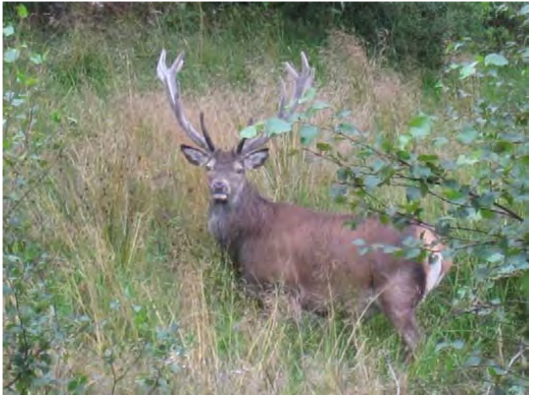
Over og under: Banemesteren på plass!