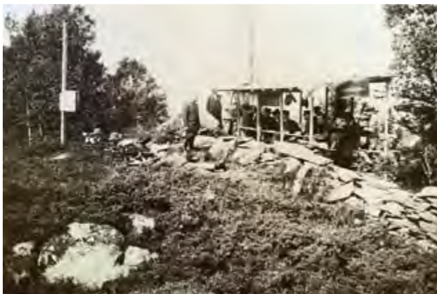
Bildet fra Landskytterstevnet i 1926 viser standplass for skyting på 800 meter.