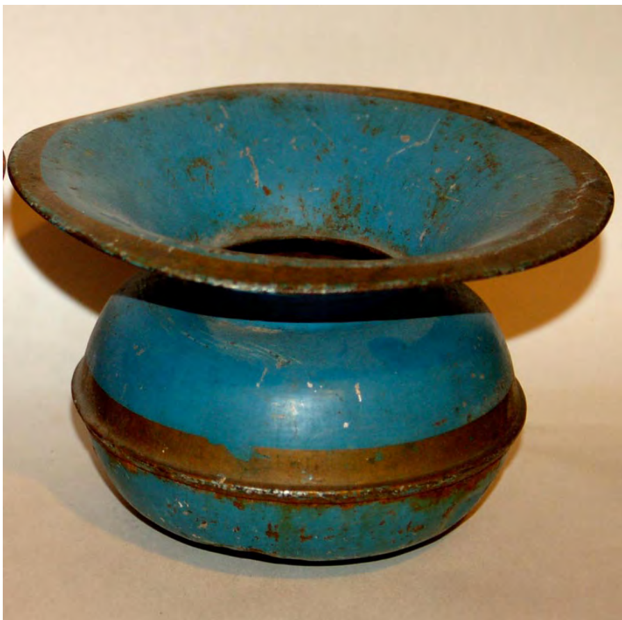
Spyttebakke fra rundt 1900. Antagelig var denne for finere folk. Allmuen brukte langt mindre kunstferdige spyttebakker.

I en av datidens kokebøker, Kogebog for Land og By , står det også at hvis mannen virkelig ønsker at kvinnen i huset skal gjøre det hyggelig for ham, burde han i det minste gå til anskaffelse av en spyttebakke og deretter sørge for å bruke den (Ødegård 1987: 61).