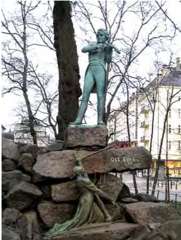
Ole Bull og nøkken, på Ole Bulls plass, avduket 17. mai 1901. Statuen er laget av bildekunstneren Stephan Sinding.