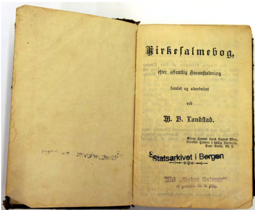
Bilde av en av de mange utgavene av Magnus Brostrup Landstads Kirkesalmebok. Den ble ved kongelig resolusjon autorisert for bruk i 1869. Boka ble første gang utgitt i 1870, og inkluderte salmer av blant annet Martin Luther og Thomas Kingo. Nynorsk salmebok kom i 1925, og det var salmer som fantes i begge disse bøkene som Rettleiinga krevde brukt under gudstjenestene som skulle på lufta.

den, men selv om man primært ønsket å sende norsk musikk, var dette vanskelig å få til: En tredjedel av musikk-sendetiden var i praksis grammofon-musikk spilt inn i utlandet. Foredrag og dramatiske fremføringer utgjorde opp imot 30% av sendetiden i 1933, mens foredrag viet til praktiske og aktuelle emner kom opp i 56%. Nyheter og aktuelle innslag opptok litt mindre enn 20% av den totale sendetiden, og gudstjenester litt mindre enn 10%.