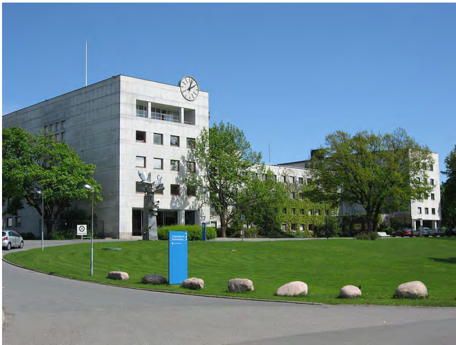
Foto av kringkastingshuset, også kalt Radiohuset. Det ble tegnet av Nils Holter og påbegynt i 1938. Huset sto ferdig i 1950.