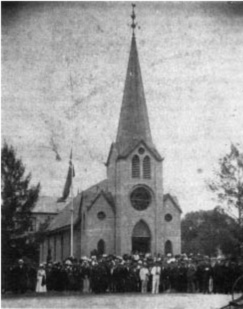
Den norske kirken i Durban. Samlingssted for utvandrede nordmenn

vilje til forsoning, noko som mellom anna resulterte i at det i 1910 vart oppretta eit samla Sør-Afrika Samband med ein boergeneral som fyrste president. Til skilnad frå Europa – der krig mange gonger har gitt sår som det har teke generasjonar og hundreår å lækja – så fann dei få kvite der sør at samhold var det einaste som kunne gje dei politisk styrke.