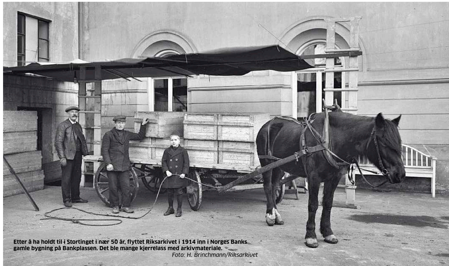
Etter å ha holdt til i Stortinget i nær 50 år, flyttet Riksarkivet i 1914 inn i Norges Banks gamle bygning på Bankplassen. Det ble mange kjerrelass med arkivmateriale.

Archivaren – Gud bevar'en! – elsker da sit Støv. Han i det jo finder Norges Hædersminder. I sin Kjælder boer han heller end blandt Rankens Løv.