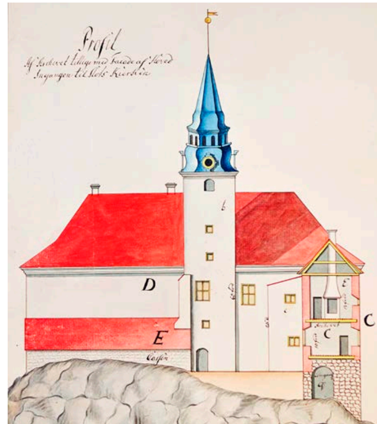
På denne profiltegningen av Akershus festning fra rundt 1760 er arkivet merket med bokstaven C.

mentet om at slik praksis ikke ville bli akseptert.