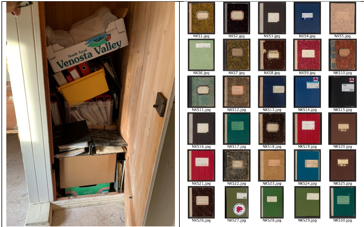
Frå uordna til digitiserte sanitetforeningsarkiv.