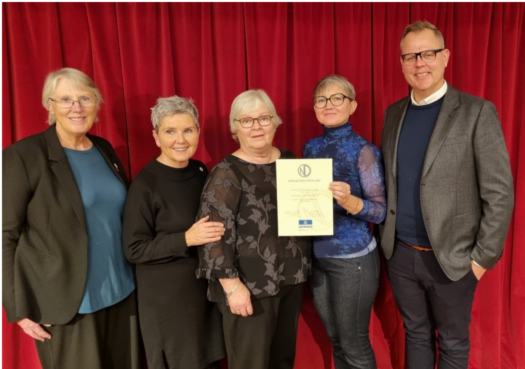
Frå tildelinga av plassen i Norges dokumentarvregister, ved Litteraturhuset i Oslo 1. desember 2022. Representantar frå NKS og IKAMR.