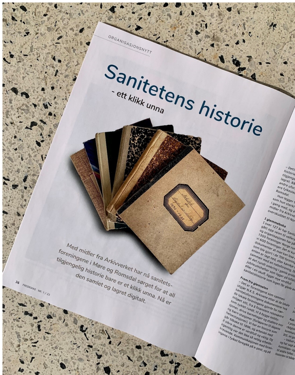
Frå Fredrikke, medlemsbladet til Norske Kvinners Sanitetsforening (nr 1, 2023).