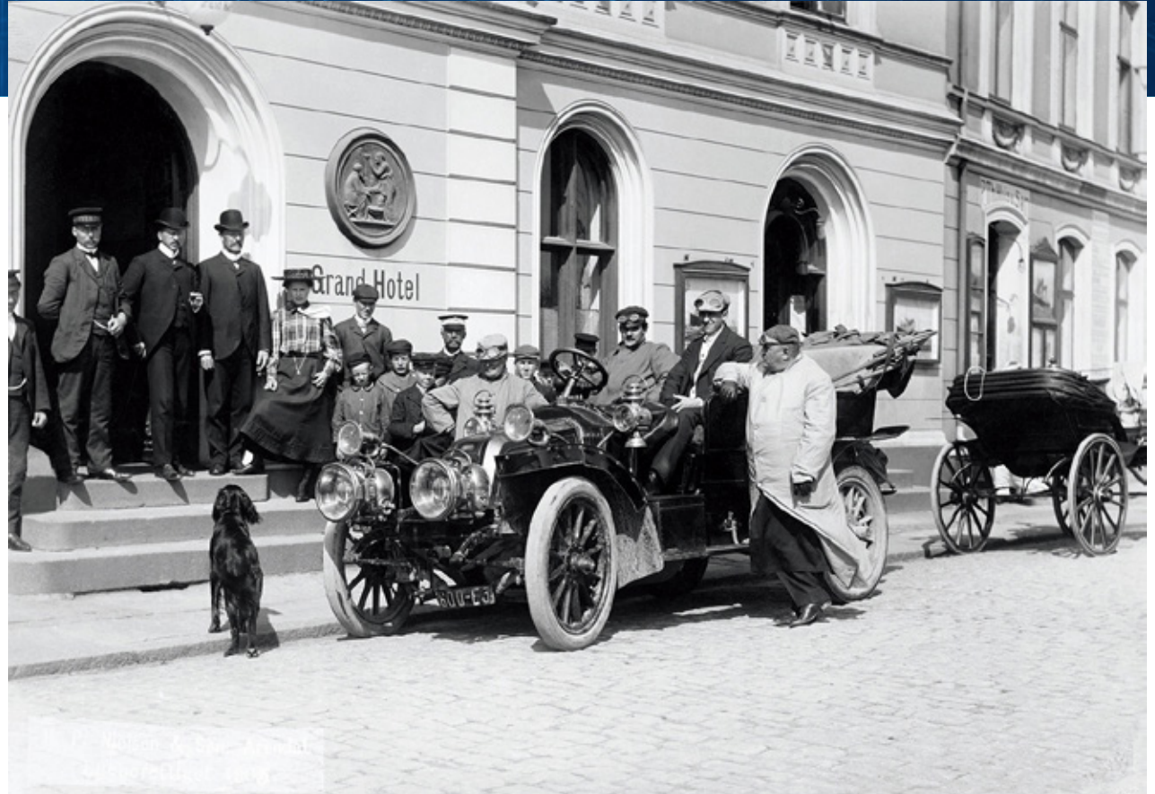
En av de første bilene på Sørlandet. Fotografert utenfor Grand Hotell i Arendal 19.juni 1905.

Gjennomgående bilde alle sider: Hovedtegning av motorkutteren «Ameta». Bygget ved Holmens verft i Risør i 1918. ARKIVREF: PA-1201, HOLMENS VERFT. ARKIVET OPPBEVARES PÅ KUBEN