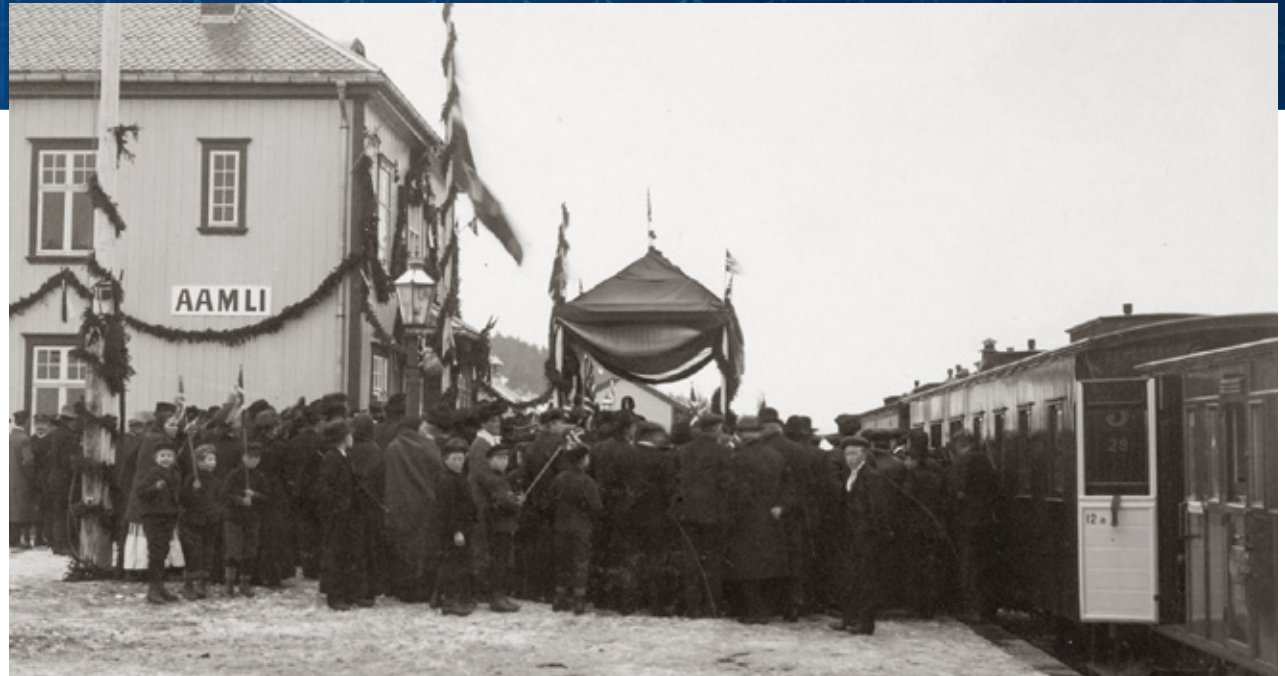
Åpning av jernbanen mellom Arendal og Åmli 17. desember 1910.

Pandemien gjorde det vanskelig å gjennomføre fysiske bestandskartlegginger, noe som var essensielt for å kunne utføre en fullstendig bestandsanalyse. Videre gjorde corona-restriksjonene det vanskelig å få til fysiske møter.