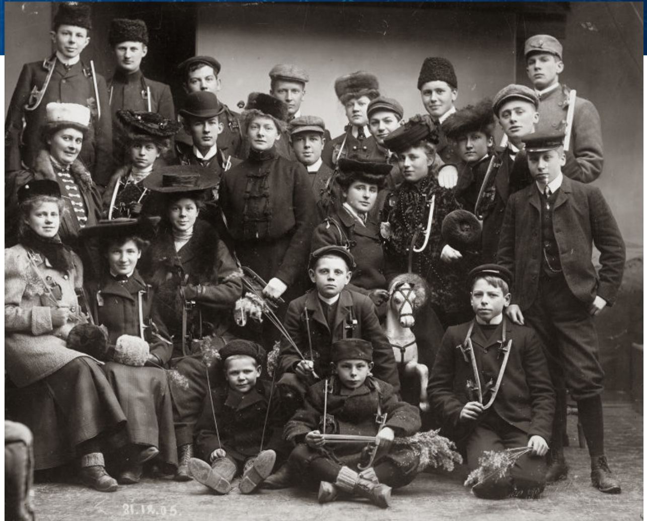
Skøyteglade barn og ungdom i Arendal. Nyttårsaften 1905.

Ved hjelp av datavisualiseringsverktøyet var det enklere å få en oversikt over hvilke arkiver som er bevart. Videre kunne man ved å speile bevarte arkiver opp mot samfunnsanalysen få en bedre oversikt over hvilke arkiver som mangler.