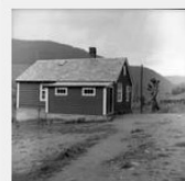
Schiøng, Johan Seljedalen, Vik, Sogn og Fjordane, bygd 1 bilde