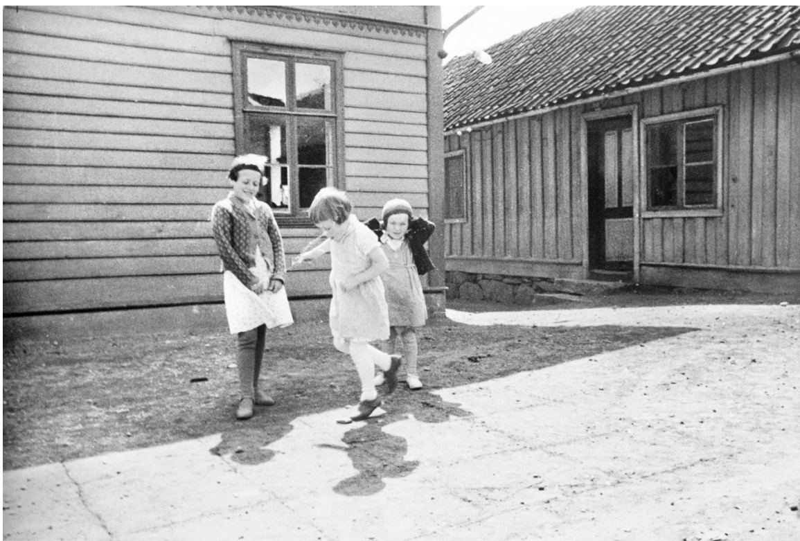
Jenter hoppar paradís, ein kjend leik på mange skuleplassar gjennom tidene. Fotograf: ukjend, ca 1935-39. Kjelde: Fylkesarkivet i Sogn og Fjordane

Prosjektet har prioritert perioden frå den første skulelova kom i 1739 til kommunesamanslåingsperioden på midten av 1960-talet. Både tilgang til kjeldemateriale og personvernsomsyn legg føringar for kva som vert digitalisert og formidla. Fylkesarkivet har mellom anna skulearkiv fram til midten av 1960-talet.